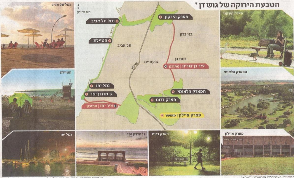
* תוכנית האדריכלים אברמוביץ ורינהאוז

מושג הטבעת הירוקה – יצירת קשר רציף בין פארקים בתוך ערים ומסביבן – נפוץ בעולם. למעשה, מיזמים דומים כבר נמצאים בשלבי ביצוע מתקדמים בירושלים, כאר שבע וחצי. גם בתל אביב לא מתכוונים להישאר מאחור