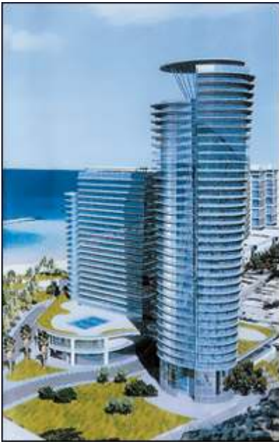
הדמיה של המגדלים